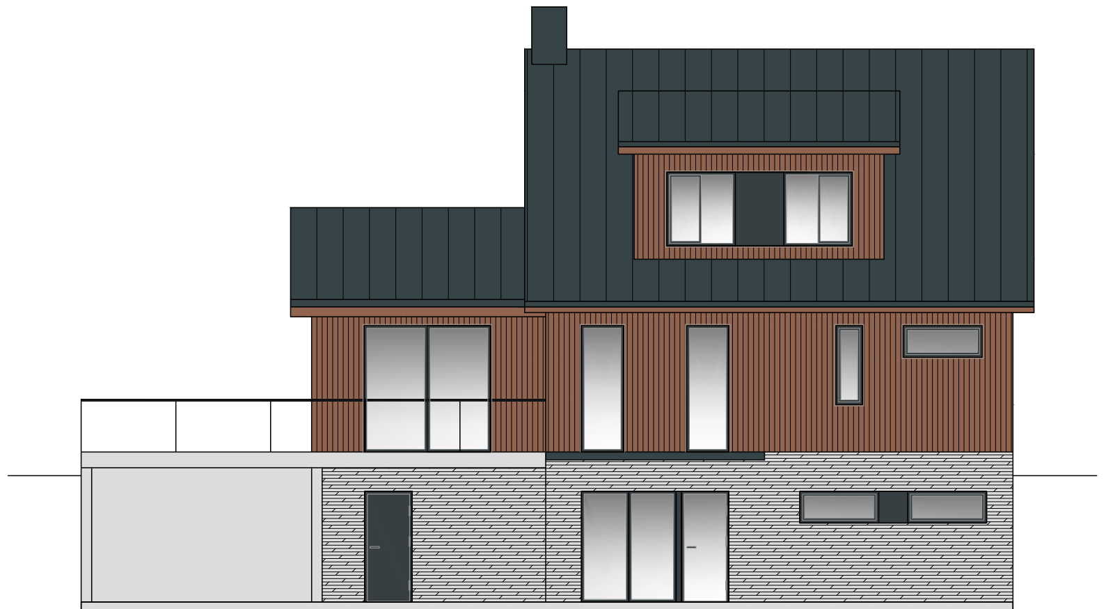
VAADE C M 1:100